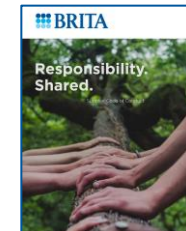
Verhaltenskodex für Lieferanten