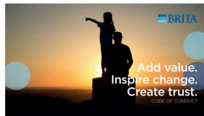
Verhaltenskodex für Mitarbeitende